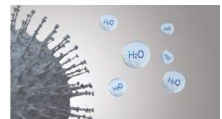
Forurenende stoffers aktivitet hæmmes.