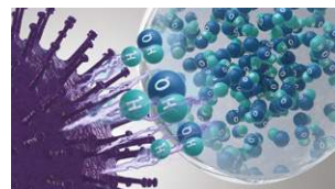
Hydroxylradikaler denaturerer proteinerne i forurenende stoffer.